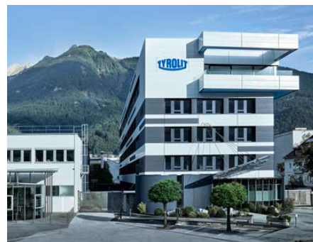
Siège social de Tyrolit à Schwaz (Autriche)

Cette entreprise familiale, dont le siège social se situe à Schwaz (Autriche), combine les forces du Groupe Swarovski dynamique dont il fait partie avec une expérience d'entreprise individuelle et technologique longue d'un siècle.